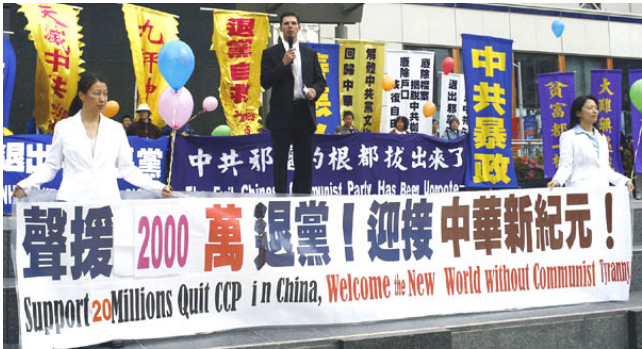
美国旧金山民众集会声援两千万中国人退出中共邪党组织