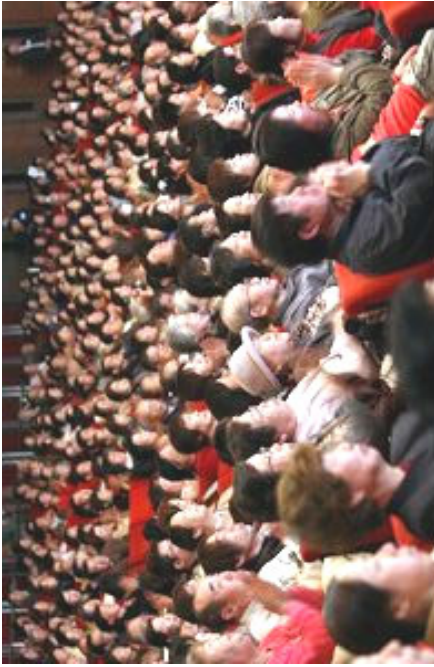
遣唐使故乡的观众在大阪西风剧场观看新唐人晚会亚洲首场演出

多位政界、学术界、法律界及华侨社区首领及台湾驻大阪经济文化办事处的官员到场观看演出。大阪地区自民党支部和国会众议员多名议员到场并致贺词。大阪和东京地区的多家媒体到场报导。◇