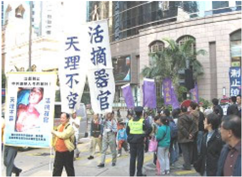
香港法轮功学员呼吁世人快快找真相,吸引了大批游客观看。

她说：“2002年，在我第一年去香港，在法轮功信息摊位旁炼功时，很多中国游客向我吐唾沫，骂我，甚至还有人想用脚踢我，非常的激烈。