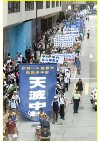
▲“天灭中共”大幡在香港九龙闹市区