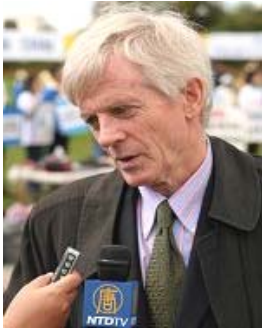
加拿大调查员乔高

【明慧网二零零七年一月十一日】（明慧记者英梓报道）近日，加拿大独立调查员大卫·乔高在渥太华接受媒体采访时表示，在游历三十个国家的首都过程中，已经获得了新的证据证明中共活体摘取法轮功学员器官（下简称：活摘器官）指控的真实性。乔高并表示将最新获得的八至九条新证据加入调查报告，并发表报告的修订本。