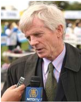
加拿大调查员乔高

【明慧网二零零七年一月十一日】（明慧记者英梓报道）近日，加拿大独立调查员大卫·乔高在渥太华接受媒体采访时表示，在游历三十个国家的首都过程中，已经获得了新的证据证明中共活体摘取法轮功学员器官（下简称：活摘器官）指控的真实性。乔高并表示将最新获得的八至九条新证据加入调查报告，并发表报告的修订本。