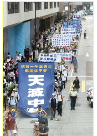
▲“天灭中共”大幡在香港九龙闹市区