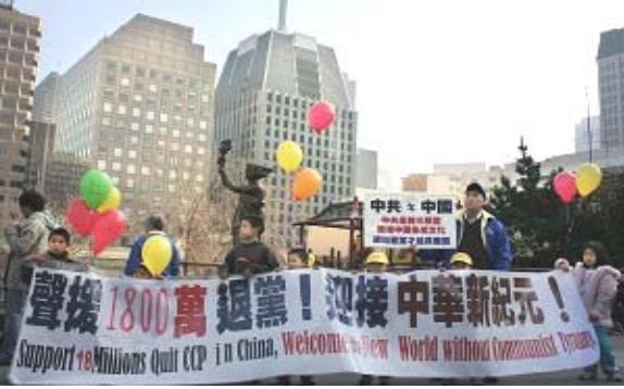
旧金山游行声援一千八百万中国民众退出中共恶党 团队