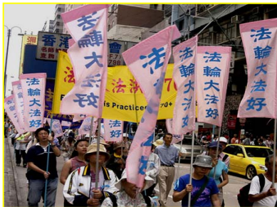
▲香港“法轮大法好”彩旗飘飘

轮功的，我了解他们都是冒着被抓、被打、被判刑、甚至生命危险在救人，资料是他们省吃俭用的钱来做的。到哪儿去领工资呢？于是我对那个中国导游说：“那他们一个月领多少钱？”那个导游的脸刷一下红了，说：“快走！赶上队伍。”随行人员都笑了。