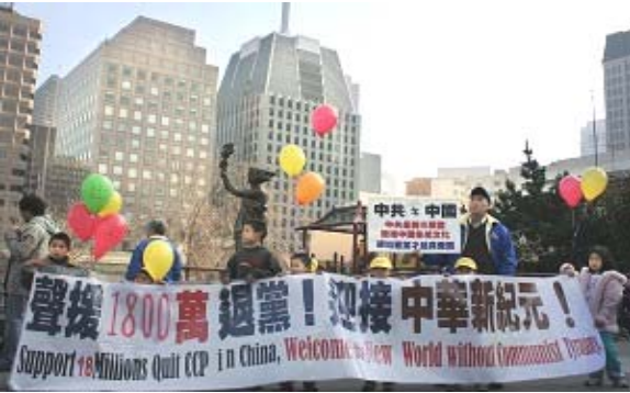
旧金山游行声援一千八百万中国民众退出中共恶党 团队