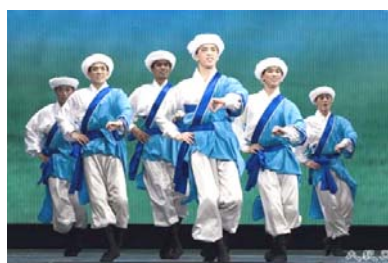
《草原牧歌》：牧马少年英勇豪迈， 飞驰在辽阔的蒙古草原上。

《草原牧歌》、《彩虹》等，展示了在正统的神传文化中，天、地、人三才和谐，男人阳刚，女人温柔优雅，天地万物，生机勃勃的景象。