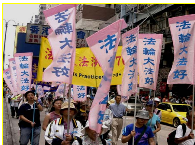
▲香港“法轮大法好”彩旗飘飘

轮功的，我了解他们都是冒着被抓、被打、被判刑、甚至生命危险在救人，资料是他们省吃俭用的钱来做的。到哪儿去领工资呢？于是我对那个中国导游说：“那他们一个月领多少钱？”那个导游的脸刷一下红了，说：“快走！赶上队伍。”随行人员都笑了。