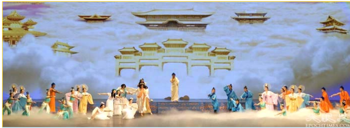
《创世》：慈悲的主佛率众神佛下世， 为苍宇众生开创美好的未来。