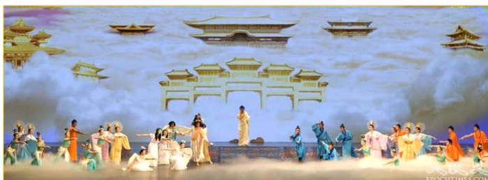
《创世》：慈悲的主佛率众神佛下世， 为苍宇众生开创美好的未来。

诉求根本就谈不上有什么政治目的，所以，中共只好用“不可告人的政治目的”来“欲加之罪，何患无辞”。这样，也就可以给人贴上“搞政治”的标签，从而大打出手了。