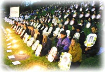
▲法轮功学员在日内瓦人权会议期间举行烛光守夜悼念被迫害致死的同修

非标准弄扭曲了。不管中共如何残害无辜，使出了如何卑鄙的手段，干的是如何流氓的行径，谁一旦被认为触及了“政治”那个“党经”，被“搞政治”迷惑的人们就不会去同情受迫害者，不去谴责施暴者，而反过来责备受迫害者，否定任何声援受迫害者的努力。好象“搞政治”是比中共杀人还要可怕的东西。