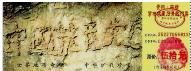
贵州省平塘县掌布乡“藏字石”风景区门票

理由三： 2002年6月在贵州省平塘县掌布乡发现了一块距今两亿多年的“藏字石”，五百年前崩裂的巨石断面内自然形成六个繁体大字：中国共产党亡（下图）。这是上天在警示世人，天灭中共在即，顺应了天意，也为自己选择了光明的未来。常言道：宁可信其有，不可信其无啊！