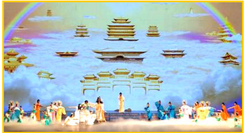
▲全球华人新年晚会美国纽约首场大型舞蹈《创世》剧照