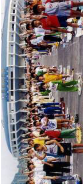
九九年七二零前深圳法轮功学员集体炼功的壮景

回想在非法镇压前，锦州市大小公园里每天都有很多人炼法轮功（又叫法轮大法），特别是1997至1999年上半年，法轮功祛病健身的神奇功效和“真善忍”的法理吸引了越来越多的人走入了炼功队伍，最后炼功人数已达到一亿人。通过修炼，人们的身体健康了，道德提升了，心态祥和了。那时从社会上层到普通百姓都说大法好，各派出所警察也都说大法好。可是迅速增长的炼功人数引起了江××的妒忌