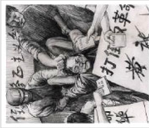
九评之七配图

中共的险恶用心，希望善良的锦州父老乡亲明察。在此邪恶的政府面前，也确实有很多基层干部看穿了邪党的惯用伎俩，都采取了上有政策，