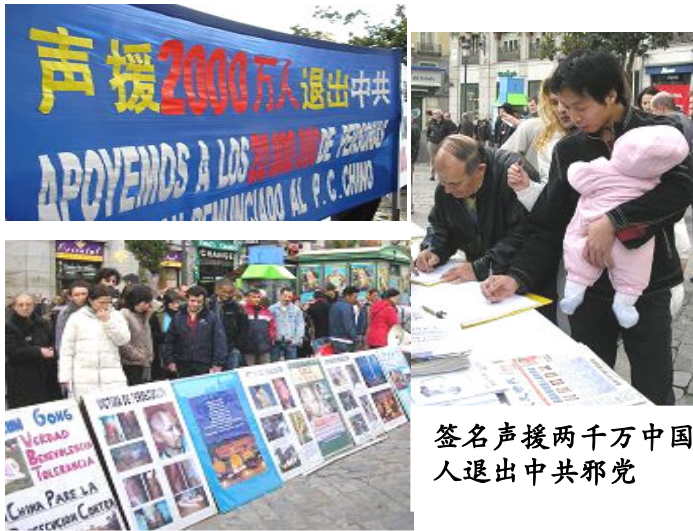
签名声援两千万中国人退出中共邪党

这些记录着中共残害中国人民的图片，触动了人们的内心深处。越来越多的海外中国人在觉醒。