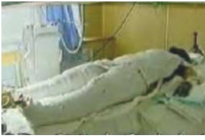
央视《焦点访谈》中的“自焚者”被包裹得严密。