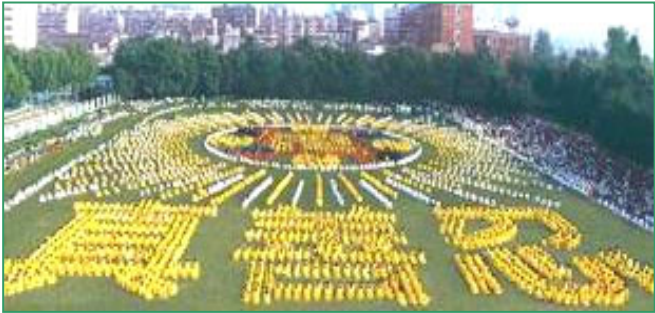
1997 年武汉市 5000 法轮功学员炼功、组字

者喜之，相继而来，修者日众。修炼者中有农、工、商、军、学、干部、专家、学者各行各业的男女老少。法轮功学员在修炼后道德回升所出现的精神风貌、工作和生活态度在民众中得到赞誉。