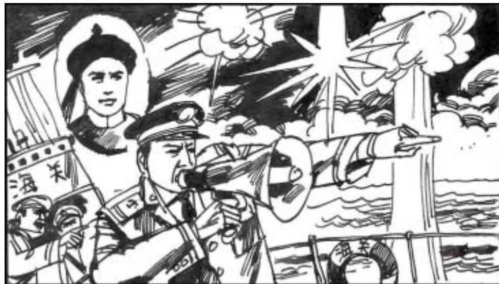
4. 1998年7月26日，北海舰队为走私油轮护航，在当年甲午海战的海域遭遇缉私艇。海军开炮造成八十七人伤亡。阵亡的十三个冤魂当中，有一位姓邓的，正是邓世昌的嫡玄孙。