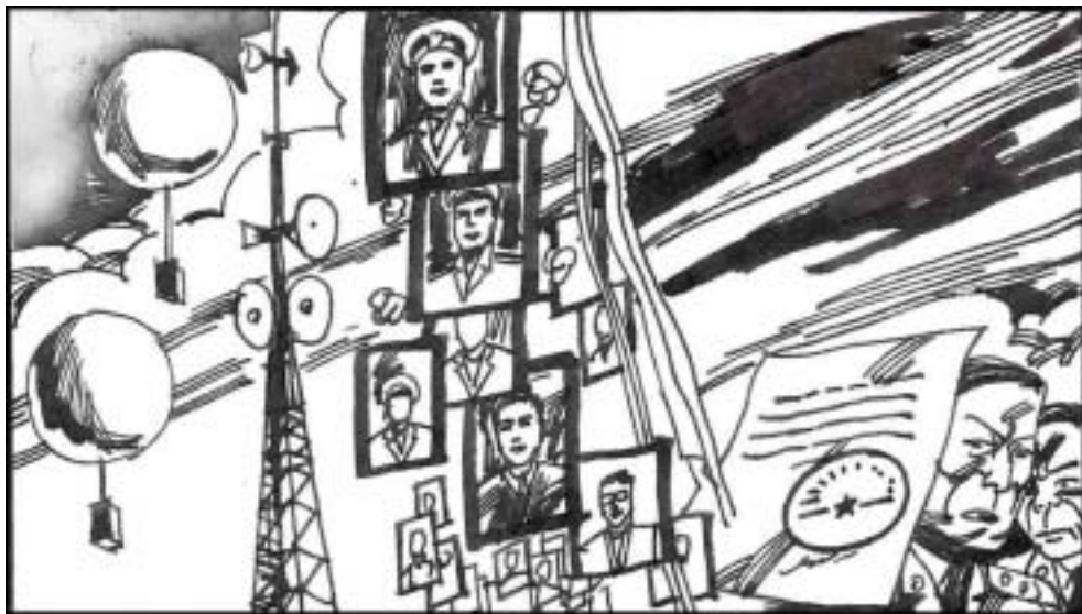
5. 军队动用军方气象台来服务，冒用总理签字，盖上军委副主席大印冒领数十亿。光 1998 年上半年军队开枪、开炮打死海关缉私人员及公安武警、司法人员 450 人，打伤 2200 多人。