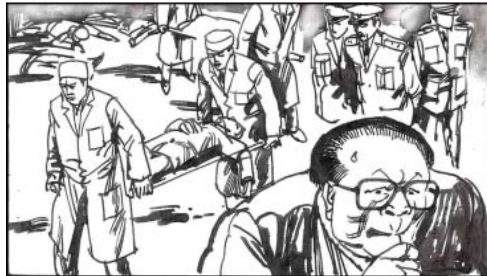
14. 在中央军委主席江泽民的领导和指挥下，“人民军队”的指战员没有死在保家卫国的战场上，却倒在了人为财死的烽火中。而这类事件几乎遍及全国各省各地，无法一一细述。