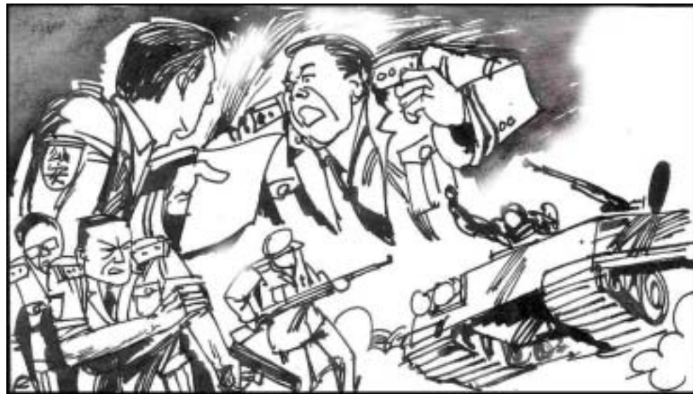
10. 撤销了军队、武警、公安经办的经济实体后，原经济实体的资产就在军中瓜分了。已经钻到钱眼儿里的军队、武警为分钱、分赃，更频繁爆发武斗，用枪、用炮甚至动用装甲车，拚个你死我活。