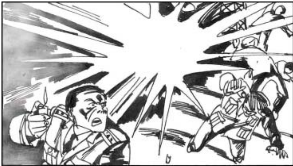
11. 某仓库主任将上级贪污的赃款雁过拔毛，被上级苦整，98年4月5日他趁营中无人到储藏室放火报复，造成湖北咸宁的“空六五六基地”雷达站大爆炸，死伤一百二十多人，损失无数。