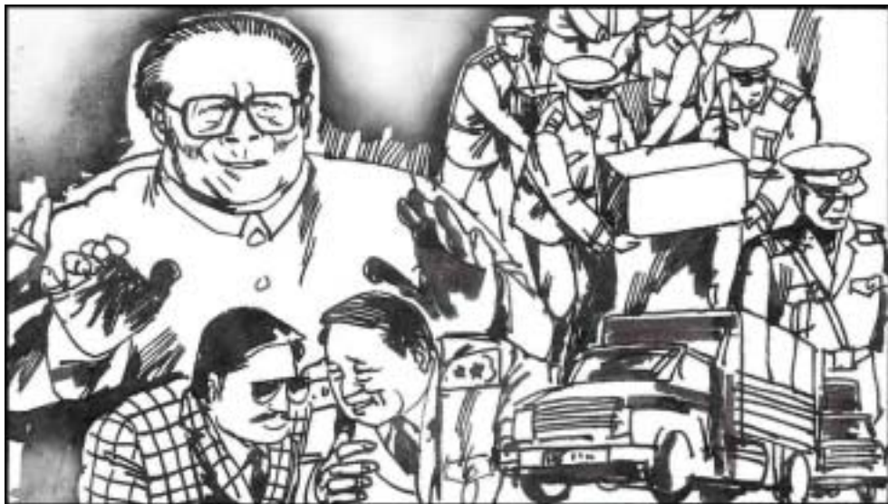
1. 80年代中期，为补贴军用，中共高层允许军队经商，成为“以军养军”。江泽民当上军委主席后，为了收买人心控制军权，放纵军队大肆经商，纵容军队腐败。结果使军匪一家，走私猖狂，情况一发不可收。