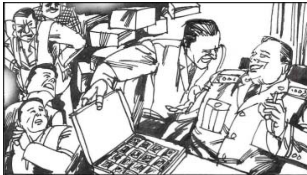
2. 军队走私，是走私队伍中的大户。逃税数以千亿计，全未补贴军用，八成以上进了军中各级将领私人腰包。事情到江泽民那里就被压下了，军队的这些行为真使海盗、响马、地方贪官皆望尘莫及。