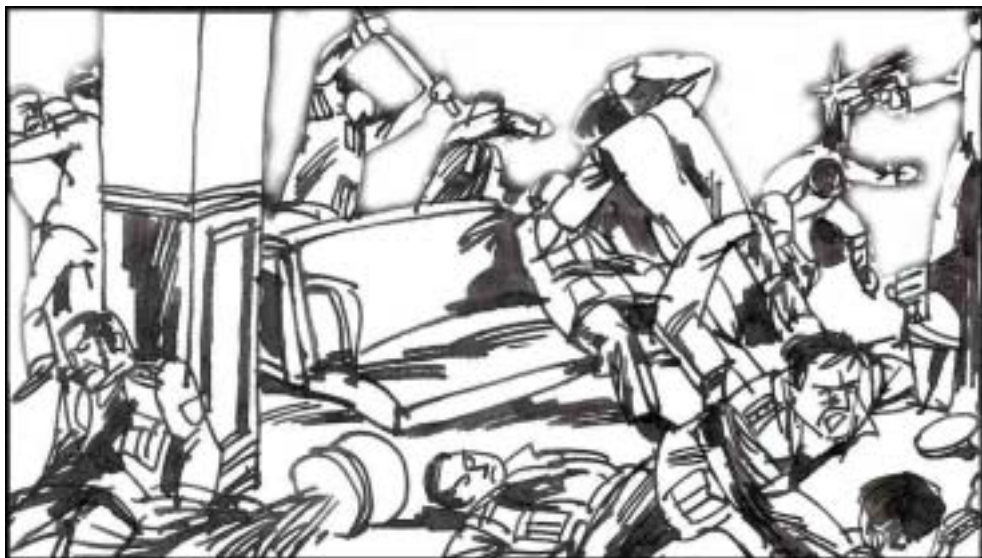
13. 华东军区属下安徽省军区，合肥市警备区和安徽省武警总队，三方合伙经商，办移交时分赃不均，引发三方在省军区礼堂混战，仅军官就伤亡三十多名。