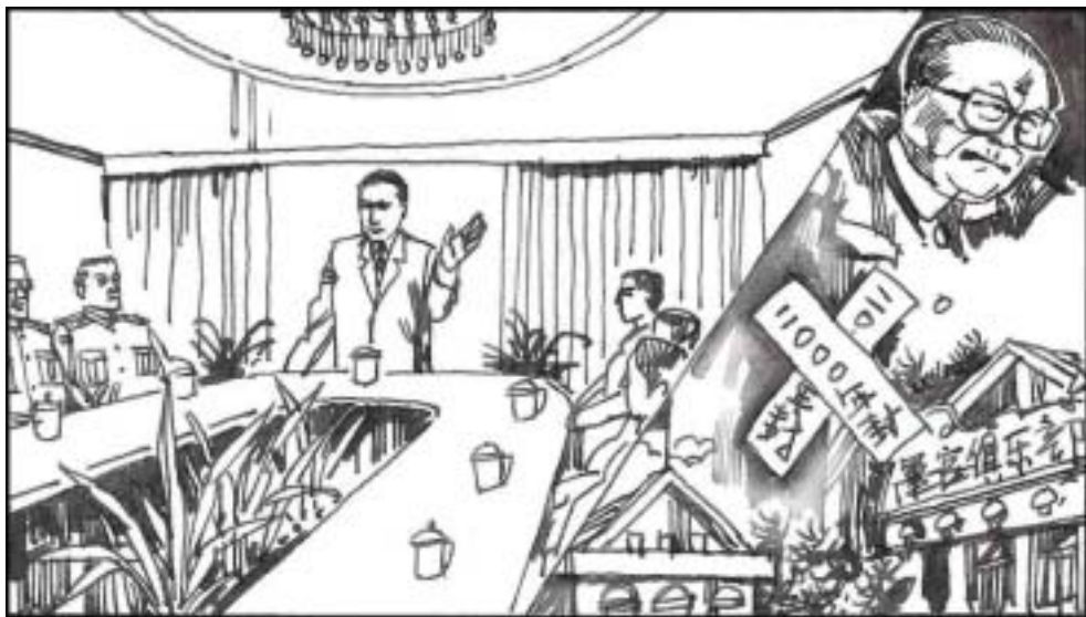
9. 2000 年六中全会决议要改善党风，中央下令查封、停办、整顿的俱乐部、招待所、度假村。这些军队娱乐场所大多是 90 年代初江泽民当军委主席后兴建的。