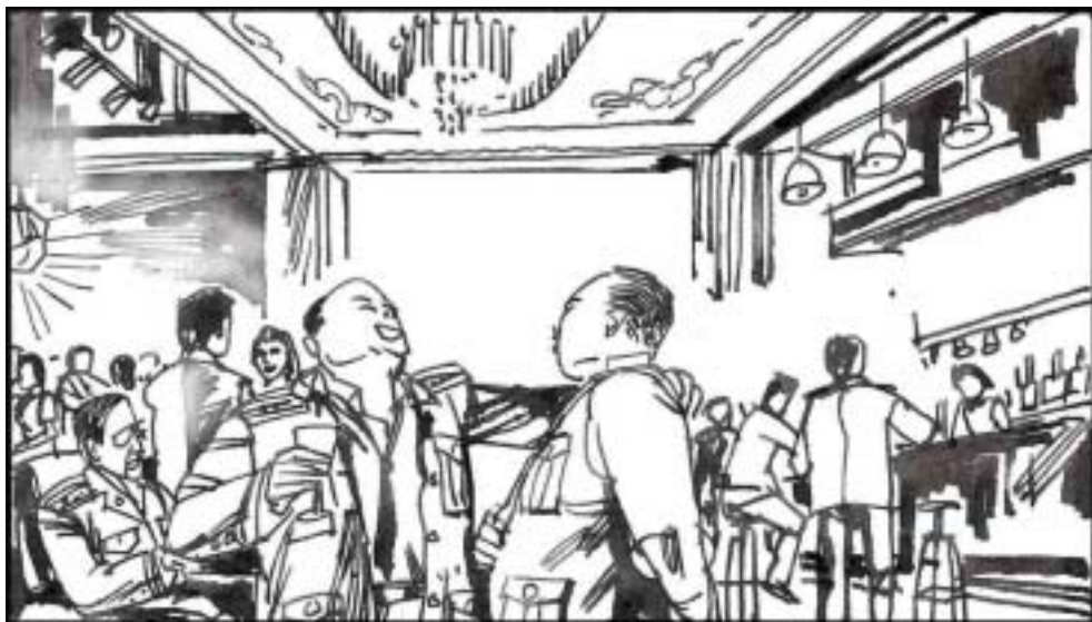
5. 俱乐部、招待所、度假村等的兴建，到了 97 年达到了高峰，特级的俱乐部、招待所、度假村等，全年每天 24 小时提供服务；高级、次高级的，一年 365 日，天天“客满”。