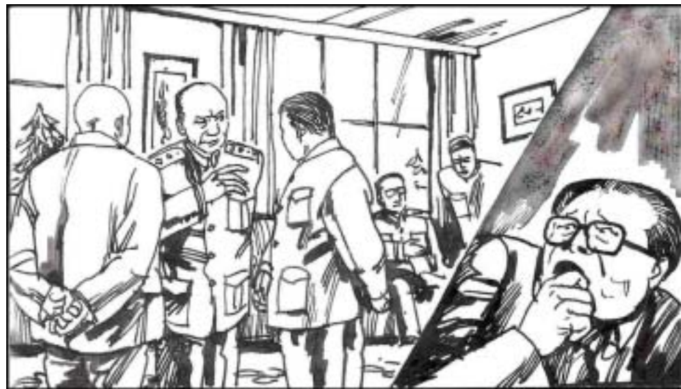
10. 军方的洪学智、萧克、廖汉生、杨成武、杨白冰等老将军，对江泽民的腐败治军非常不满，江泽民虽恨他们但又惧怕他们联合起来对付自己，所以硬的不敢来，就下软刀子。