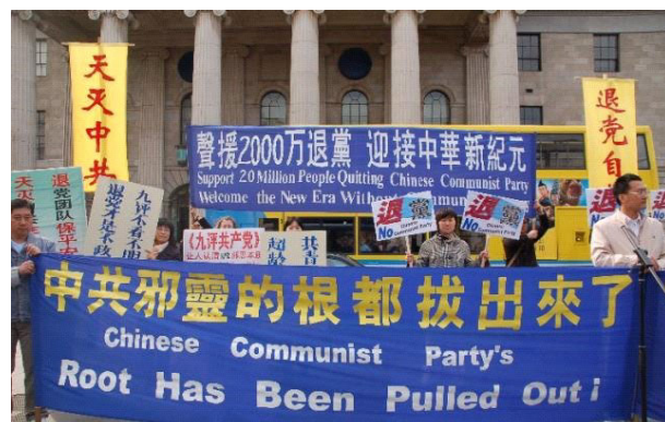
▲爱尔兰集会声援两千万人退出中共

隔天他又来电话说，「我们这地区，现在雷电交加，还下七八厘米大的冰雹，在山东的春天是很少见的，这就是天地反常，真是老天爷要灭中共」。◇