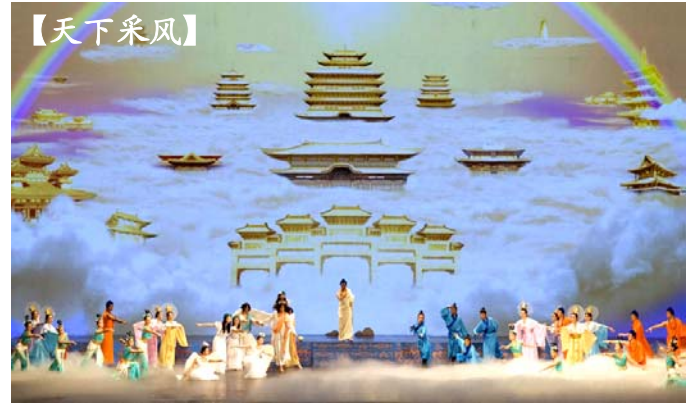
晚会开场节目《创世》：主佛率众神下世，为众生开创美好的未来。