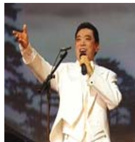
关贵敏在2007年全球华人新年晚会上演出

作为法轮功修炼者、享有男高音之王的歌唱家关贵敏有着深深的触动，他说：“没修炼前也常到