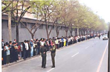
学员没有标语口号没有阻塞交通

是在北京市府右街的国务院信访办（邻近中南海西门），如果信访办在其它地方，法轮功学员根本就不会去中南海。