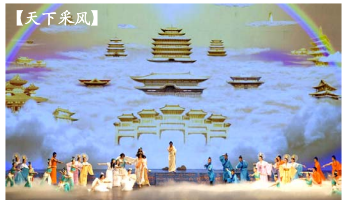
晚会开场节目《创世》：主佛率众神下世，为众生开创美好的未来。