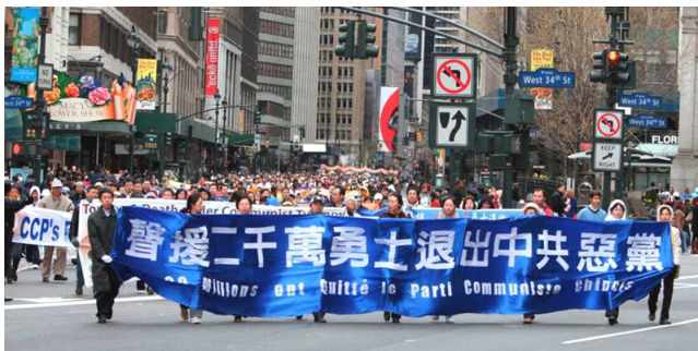
世界各地民众游行庆祝退党团队人数超过二千万

交警、警察、各级领导本应以保护老百姓安危为第一职责，听到老百姓车祸逢凶化吉的消息应该为老百姓高兴、并对挽救老百姓性命的佛法感激才对，可中共控制下的交警、警察、各级领导竟然把这一切都当作自己“建功立业、升官发财”的资本加以利用。众所周知，这种怪象在中共统治下不是个别警察和官员的个人行为，而是具有普遍性的。难怪现在到处流传着这样的预言：“天意现，中共将亡；保平安，退党团队”。◇