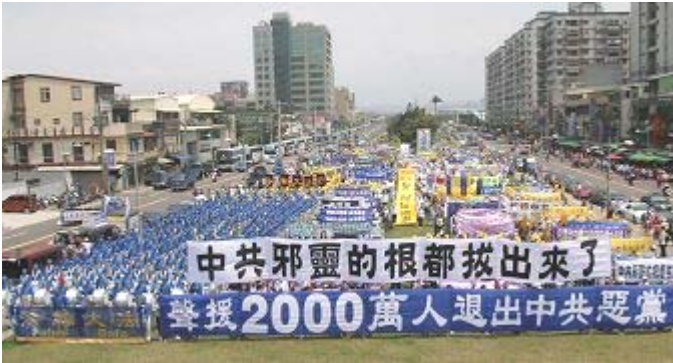
世界各地民众游行庆祝退党团队人数超过二千万

《九评共产党》一书深刻揭露了中共邪恶本质，已在中国促成强大的退出中共恶党的大潮，到 2007 年 4 月 17 日已有超过 2083 万中国民众在海外大纪元网站声明退出中共党、团、队。其中包括中共党政军高层内的党员。