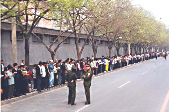
上访学员安静祥和没有阻塞交通警察没事闲聊

是在北京市府右街的国务院信访办（邻近中南海西门），如果信访办在其它地方，法轮功学员根本就不会去中南海。