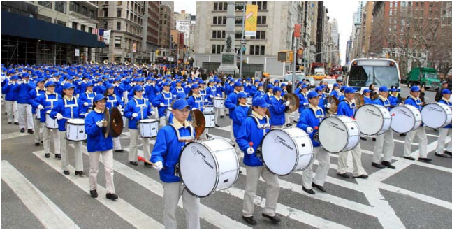
声势浩大的天国乐团

第三方阵有民主人士、团体参加，主体横幅是“中共邪灵的根都拔出来了”，“声援二千万退党勇士”。方阵最后是狮龙舞，祝贺二千万退党者抹去兽印得到美好未来。