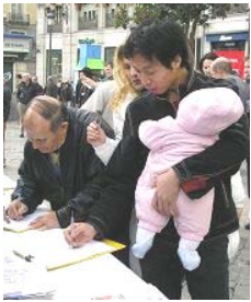
签字声援两千万中国人退出中共邪党