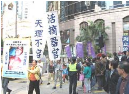
香港法轮功学员呼吁世人快快找真相,吸引了大批游客观看

他们看了信息摊位上的各种真相图片，看了连续播放的关于法轮功受到迫害的真相影片和<<九评共产党>>的DVD 影片后，有的人开始改变，甚至眼里含着泪水。