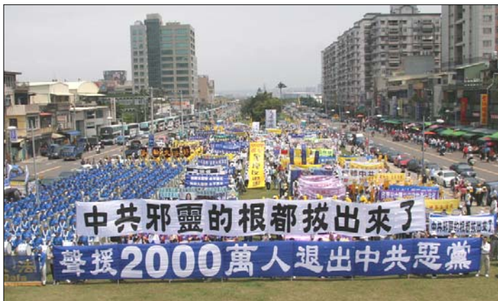
图：台湾新竹举办「声援二千万人退出中共」活动

《九评共产党》一书深刻揭露了中共邪恶本质，已在中国促成强大的退出中共恶党的大潮，到2007年4月20日已有超过2087万中国民众在海外大纪元网站声明退出中共党、团、队。其中包括中共党政军高层内的党员。