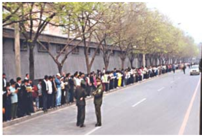
学员没有标语口号没有阻塞交通