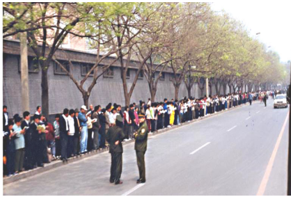
学员没有标语口号，没有阻塞交通。 警察无事闲聊天

当晚9点多，学员们得知后，悄然离去。离开后地上无一片纸屑，甚至连警察扔下的烟头都清扫一净。在场的警察感慨地说“看，这就是德！”