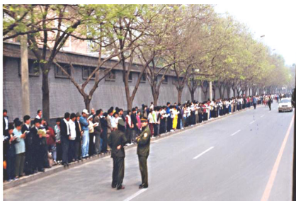
学员没有标语口号，没有阻塞交通。 警察无事闲聊天

当晚9点多，学员们得知后，悄然离去。离开后地上无一片纸屑，甚至连警察扔下的烟头都清扫一净。在场的警察感慨地说“看，这就是德！”