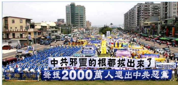
全球声援两千万人退出中共的大型活动已覆盖北美、欧洲及亚洲等十多个国家，声势浩大。图为四月十五日，近四千民众在台湾举行大游行，声援退党潮。

有个女同事的家离我家不远，我们经常相互串门，她家都知道我炼法轮功，看到了我修炼前后的变化，也明白法轮功真相。这位女同事的丈夫只要在电视里看到污蔑法轮功的节目，马上就把电视关掉，他非常气愤的对我说：中国从上到下到处可见吃喝嫖赌、贪污腐败，那些当官的不管下岗职工的死活，却整天把大量的人力、财力和时间用在打压法轮功问题上，这不更显得中共（邪党）无能和渺小吗？