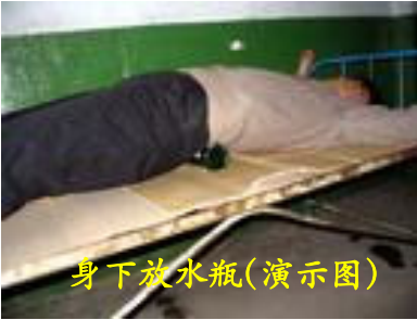
身下放水瓶(演示图)

号),称之为“心理矫治中心”。在小号的地上安四个铁铐,把人固定到上面,每个小屋还有一个抻床也叫固定床,是残酷折磨人的一种刑具,把人固定到床上,四肢用铁铐扣住,可以随便折磨人,踢、打、上身上踩,用开水瓶烫、用针扎、不让睡觉。其中最残酷的就是把人固定住,腹面朝上,然后往背上加东西(主要是棉被、水瓶、木板等),他们加压力,把整个人整个身子悬起来,整个四肢都被抻紧,手脖子、脚脖子的肉慢慢的被撕开,手脚已经不过血,骨头节都被抻开了,撕心裂肺的痛,而且是腰部向上拱,头向后仰,呼吸困难,脸色苍白。有的法轮功学员被他们固定到床上迫害,短则十多天,二十多天,还有一、二个月的,身体受到严重的摧残,身体肌肉开始萎缩,四肢无力,走路扶着墙走,骨瘦如柴,到冬季手脚都冻伤。