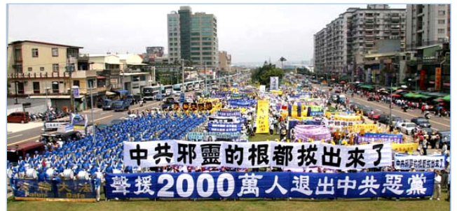
全球声援两千万人退出中共的大型活动已覆盖北美、欧洲及亚洲等十多个国家，声势浩大。图为四月十五日，近四千民众在台湾举行大游行，声援退党潮。

人不治天治，这一切只是天灭红魔的历史大戏的一部份。上天慈悲，在惩治少数不可救要的恶人的同时，也传递着对世人的警示：所有不知醒悟、继续追随中共红魔者都将面临极其危险的惩罚。