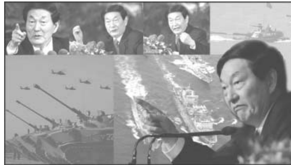
6. 江泽民做秀的本事了得，在各个场合大玩文字游戏，却把朱镕基推到记者面前发表强硬谈话，一石二鸟，不仅逃避责任，还让老冤家朱镕基的形象大跌。