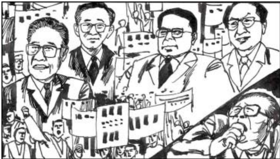
1. 1996年3月23日，台湾举行了第一次民主大选。总统候选人除了李登辉之外，还有无党籍人士陈履安和林洋港，以及民进党候选人彭明敏。江泽民对台湾的选举十分担心，害怕会鼓励了国内民众的民主诉求。