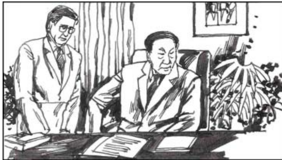
14. 朱镕基被江泽民利用在记者面前大放厥词，结果本来在国际上良好的声誉和形象大受影响，成了这闹剧中受伤最重的人。