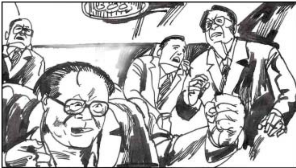
9. 借“六四”投机爬上来的江泽民笃信强权，只相信强制与恐吓，结果栽了个大跟头，对中共高层的震动也很大。