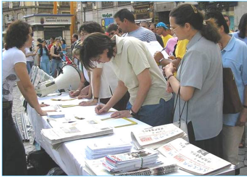
图：民众踊跃签名支持西班牙法院调查中共犯下的群体灭绝罪。

【明慧网】二零零七年四月十日，正在出访西班牙的中共政治局常委吴官正，被法轮功学员以酷刑折磨和群体灭绝法轮功学员的罪名起诉。自一九九七年起至二零零二年十一月，吴官正任山东省中共省委书记期间，直接参与并执行了江泽民镇压法轮功学员的指令，在山东省酷刑折磨致死至少上百名法轮功学员。◇