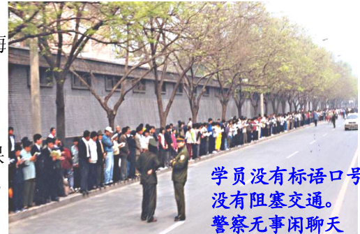
学员没有标语口号，没有阻塞交通。警察无事闲聊天

八年前的今天，一九九九年的四月二十五日，在北京市府右街的国务院信访办（邻近中南海西门），超过万名法轮功学员和平上访要求释放在天津被抓的45名学员，保障合法的炼功环境，允许法轮功书籍出版发行。当时的国务院总理朱镕基接见了法轮功代表，与学员代表会谈，后朱镕基令天津公安局放人，并重申了国家不会干涉群众炼功的政策。