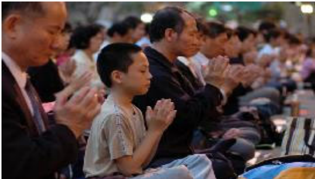
(上图：台湾法轮功学员强烈抗议中共法西斯兽行)

善良的荆州市父老乡亲，真心的希望你们都能够真正了解法轮功的真相，早日认清邪党毒害世人的本质，退出邪党的一切组织，为自己的生命选择一个美好的未来！