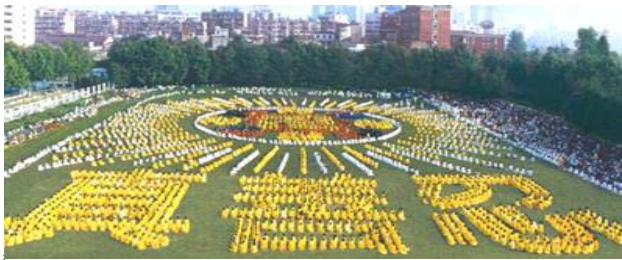
1997 年武汉市 5000 法轮功学员炼功、组字

学、干部、专家、学者各行各业的男女老少。法轮功学员在修炼后道德回升所出现的精神风貌、工作和生活态度在民众中得到赞誉。