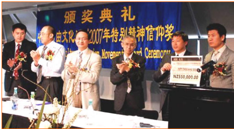
“中国自由文化运动”授予法轮功“特别精神信仰奖”

四月八日，“中国自由文化运动二零零七年特别精神信仰奖”颁奖大会在奥克兰欧缇会议中心举行。自由文化运动发起人袁红冰表示，这是中国的自由知识份子第一次以