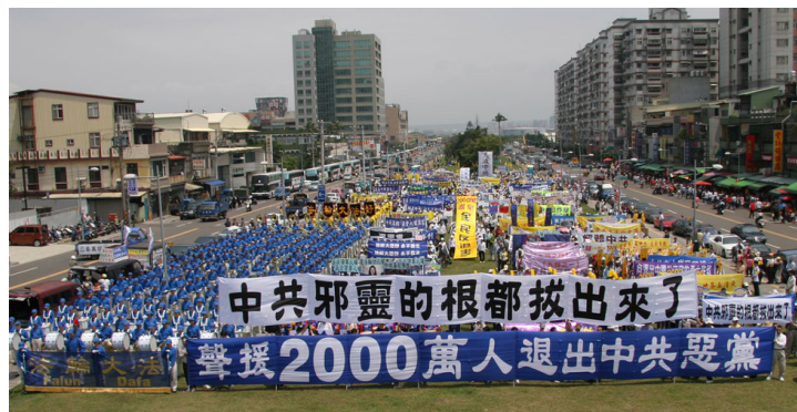
世界各地民众游行庆祝退党团队人数超过二千万

发誓“为之奋斗终生”，成为它的一分子。在《圣经启示录》上说，发此毒誓的人就被打上兽记，如果人们不脱离这恶魔，就将在天灭中共时成为它的牺牲品，这绝非危言耸听，古今中外的预言里也都在不断提醒人们这件生死存亡的大事。