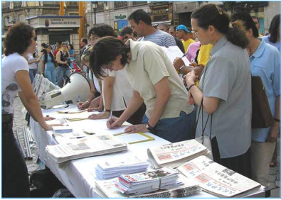
民众踊跃签名支持西班牙法院调查中共犯下的群体灭绝罪。

【明慧网】二零零七年四月十七日，正在出访西班牙的中共政治局常委吴官正被法轮功学员以酷刑折磨和群体灭绝法轮功学员的罪名起诉。自一九九七年起至二零零二年十一月，吴官正任职山东省中共省委书记期间，直接参与并执行了江泽民镇压法轮功学员的指令，在山东省酷刑折磨致死至少上百名法轮功学员。