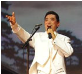
关贵敏在2007年全球华人新年晚会上演出