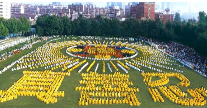
1997年武汉市 5000 法轮功学员炼功组字

者中有农、工、商、军、学、干部、专家、学者各行各业的男女老少。学员们在修炼后道德回升所出现的精神风貌、工作和生活态度在民众中得到赞誉。