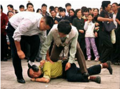
警察在殴打天安门为法轮功和平请愿的法轮功学员

党没那么坏吗，今天从中国回来变腔调了？” 她就给我讲了这次经历。这次公司让她带了一个海外华人组成的 60 多人的团到北京等景点游玩。当他们这一团人来到北京天安门广场上正在拍照留念的时候，她一海外同行带着 20 多名韩国客人也到了天安门广场，于是她就过去跟她的同行唠嗑，叽叽喳喳的唠得挺高兴的。 大家知道，韩国人有个习惯，愿意盘腿坐在地上说说笑笑的。可能这些韩国客人们累了吧，于是就把他们的旅行包放在广场的地上，20 多人盘腿坐了一圈说笑。也就不到五分钟吧，我朋友和她的同行就看到一辆加长警车和许多武警、便衣、警察便向他们冲了过来，当时她们就吓呆了，接下来这些“训练有素”的“人民警察”把所有韩国客人无论男女全按在了地上，然后挨个押上了警车，武警喊着：“不准乱动，不准喊。” 可能韩国人听不懂中文吧，有两个年轻韩国大学生不服，喊了起来，大概是质问警察干什么吧。这时武警发挥了中国武术优