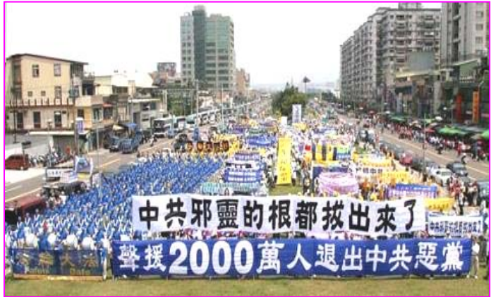
▲ 全球声援两千万人退出中共的大型活动已覆盖北美、欧洲及亚洲等十多个国家，声势浩大。图为四月十五日，近四千民众在台湾举行大游行，声援退党潮。

不言而喻，全球的大声援是基于国内人民大规模三退这一事实。自去年12月以来，退党、团、队的人数急剧增加，在大纪元退党网上声明三退的人数，每月超过100万，每日人数增加到3-4万，总人数已超过两千一百万。反观中国50年来的历史，多少人既是受迫害者，又是迫害的推波助澜者，被迫默许着独裁暴力。今天不同了，每个人都可以选择退出中共、去除党性、回归人性，用人善良的本性对待生活中的一切，这不就是中国未来的希望所在吗？