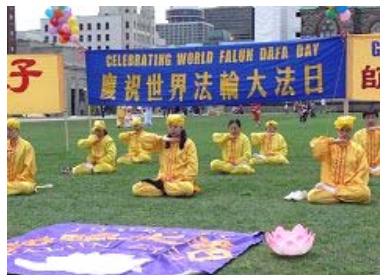
2007年5月13日，加拿大渥太华举行第八届世界法轮大法日庆典。