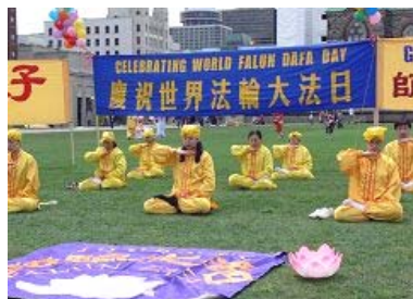
2007年5月13日，加拿大渥太华举行第八届世界法轮大法日庆典。