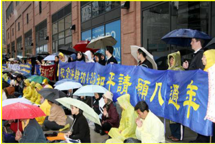
美国纽约学员纪念“四·二五”

历次运动中，中共要打倒谁，得先给戴上几顶“帽子”；“4.25”法轮功学员上访，诉