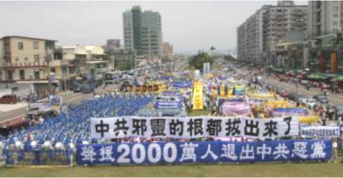
世界各地民众游行庆祝退党团队人数超过二千万