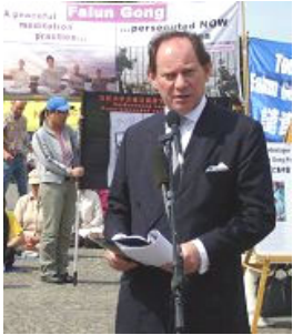
欧洲议会副主席： 所有的国家都应 支持法轮功学员

【明慧网二零零七年五月十五日】二零零七年五月十四日，欧盟与中共人权对话的前一天，欧洲法轮大法学会在柏林市区勃兰登堡门前广场举行集会，呼吁欧盟与中国进行公开的人权对话，而且对话内容应该真正涉及到中国每个人的人权问题，并要求欧盟公开谴责中共对中国民众的人权践踏。