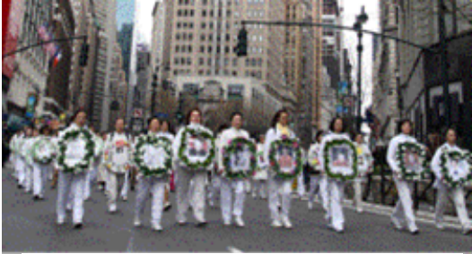
悼念遭中共迫害致死的大陆同修

千余名大法弟子举着各式横幅和展牌向世人揭露中共迫害法轮功犯下的震惊天地的滔天大罪。一九九九年七月，恐怖大王从天而降，邪恶的中共流氓集团开始了对善良修炼人的残酷迫害，据明慧网统计，至今已有超过三千法轮功学员被