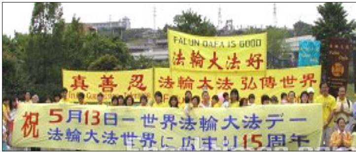
日本的法轮大法学员庆祝法轮大法创始人李洪志先生华诞暨第八届世界法轮大法日

二零零七年五月十三日是法轮大法洪传世界的十五周年纪念日，也是第八个“世界法轮大法日”。