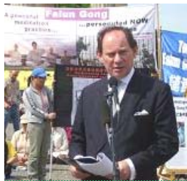
欧洲议会副主席： 所有的国家都应 支持法轮功学员