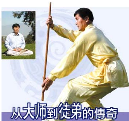
从大师到徒弟的傳奇

法轮大法（法轮功）自一九九二年五月传出以来，迄今已历十五年。法轮大法揭示宇宙特性“真、善、忍”，学炼者普遍身强体健、心性道德提升。法轮大法已经洪传八十多国，使全世界超过一亿人身心受益，深受各族裔人士喜爱，《转法轮》已被翻译成三十多种文字。