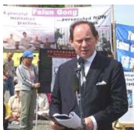
欧洲议会副主席： 所有的国家都应 支持法轮功学员

不能给李有甫带来真正的满足。李有甫说：“自从我开始练气功以后，特别是特异功能的研究，让我明白人是有前生来世的，这世界是有另外空间存在的，而唯物论否定另外空间的存在，把人的认识完全局限在我们看得见摸得着的物质空间里，这样的世界观是看不到宇宙真相的，我相信宗教中说的都是真的，于是我开始在宗教中寻找人生真谛。我尝试了许多修佛修道的法门，但最后总感到其基本内涵都失传了，怎么练也提高不大。”