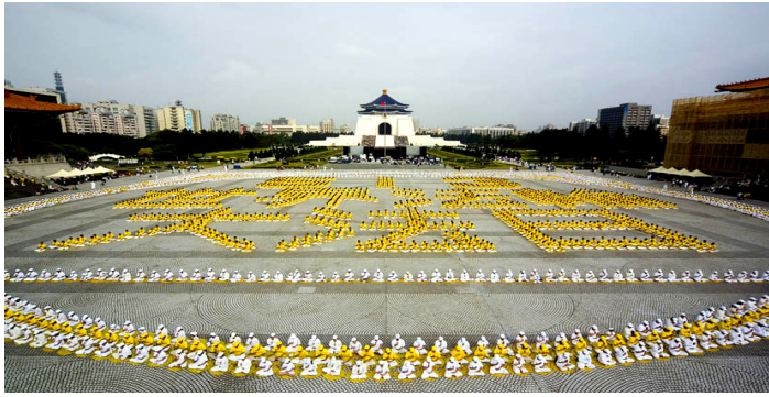
台湾五千多名法轮功学员排出壮观的“五一三世界法轮大法日”