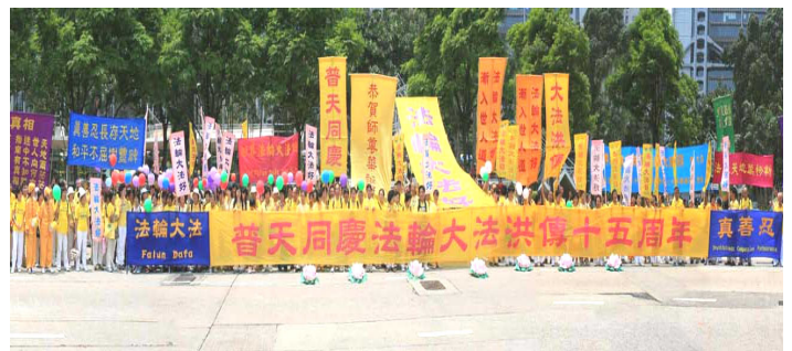
香港全体学员贺师尊华诞暨庆祝第八届世界法轮大法日

5月13日，是“世界法轮大法日”，是法轮大法开传的日子，也是法轮功创始人李洪志先生的华诞。2007年5月13日，美、欧、亚、澳洲的各国法轮功学员举行盛大游行、文艺演出等活动，表达对师父的感恩，欢庆“第八届世界法轮大法日”，庆祝大法洪传世界15周年。