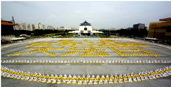
台湾五千多名法轮功学员排出壮观的“五一三世界法轮大法日”