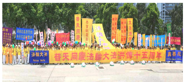
香港全体学员贺师尊华诞暨庆祝第八届世界法轮大法日

5月13日，是“世界法轮大法日”，是法轮大法开传的日子，也是法轮功创始人李洪志先生的华诞。2007年5月13日，美、欧、亚、澳洲的各国法轮功学员举行盛大游行、文艺演出等活动，表达对师父的感恩，欢庆“第八届世界法轮大法日”，庆祝大法洪传世界15周年。