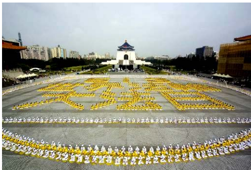
五千名法轮功学员在台湾中正纪念堂排出壮观字形：“5.13世界法轮大法日”，恭祝师尊生日快乐。

轮大法开传的日子，也是法轮功创始人李洪志先生的华诞。十五年前的这一天，李洪志师尊在中国长春第一次把法轮大法面向社会传出，以“真善忍”法理，开启人们的心智，使千千万万人的道德回升，体魄强健，给大地灌入无量的生机和祥和。2007年5月13日，美、欧、亚、澳洲的各国法轮功学员举行盛大游行、文艺演出等活动，表达对师父的感恩，欢庆“第八届世界法轮大法日”，庆祝大法洪传世界15周年。