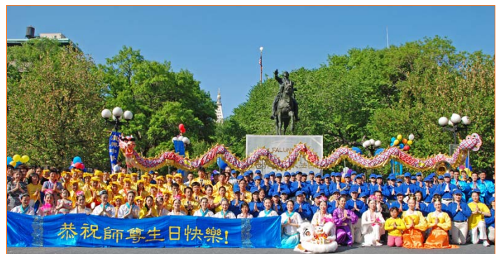
图：纽约法轮功学员在曼哈顿联合广场庆祝大法日