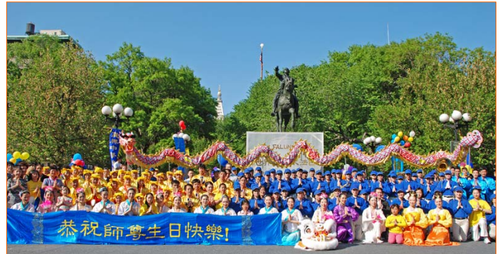
图：纽约法轮功学员在曼哈顿联合广场庆祝大法日