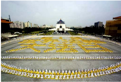
五千名法轮功学员在台湾中正纪念堂排出壮观字形：“5.13世界法轮大法日”，恭祝师尊生日快乐。

轮大法开传的日子，也是法轮功创始人李洪志先生的华诞。十五年前的这一天，李洪志师尊在中国长春第一次把法轮大法面向社会传出，以“真善忍”法理，开启人们的心智，使千千万万人的道德回升，体魄强健，给大地灌入无量的生机和祥和。2007年5月13日，美、欧、亚、澳洲的各国法轮功学员举行盛大游行、文艺演出等活动，表达对师父的感恩，欢庆“第八届世界法轮大法日”，庆祝大法洪传世界15周年。