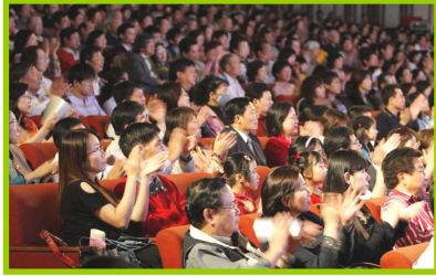
台湾观众欣赏“神韵”的演出

“神韵”亚太巡演期间，几乎场场落幕时，全体观众起立向演员致意，掌声经久不息，观众频呼“太好了，太棒了，希望神韵每年都来”。各国政要、学术界、法律界、文艺界、及社会精英纷纷发来贺词，更多的是扶老携幼、齐聚一堂的观看演出。许多贵宾亲自到场观赏，会后乐于接受媒体采访，以分享他们心灵的震撼与由衷的激赏。台湾总统陈水扁、行政院长