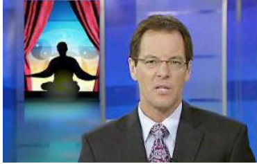
新西兰国家电视台报导： 中共干扰“神韵”演出