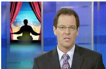
新西兰国家电视台报导： 中共干扰“神韵”演出