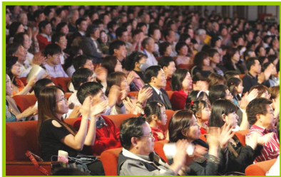
台湾观众欣赏“神韵”的演出

“神韵”亚太巡演期间，几乎场场落幕时，全体观众起立向演员致意，掌声经久不息，观众频呼“太好了，太棒了，希望神韵每年都来”。各国政要、学术界、法律界、文艺界、及社会精英纷纷发来贺词，更多的是扶老携幼、齐聚一堂的观看演出。许多贵宾亲自到场观赏，会后乐于接受媒体采访，以分享他们心灵的震撼与由衷的激赏。台湾总统陈水扁、行政院长