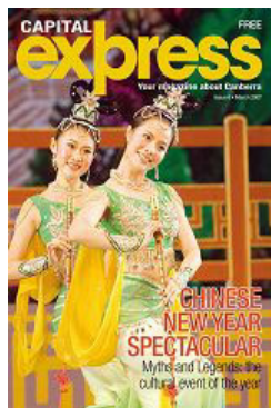
澳洲首都快报 介绍神韵艺术

要观看“神韵”的演出活动，数十位准备观看演出的社会各界要员证实接到了类似电话，都表示感到很大压力，但仍按原计划参加晚会。报导说，这场演出演绎了五千年的中国传统文化，但