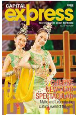
澳洲首都快报 介绍神韵艺术

要观看“神韵”的演出活动，数十位准备观看演出的社会各界要员证实接到了类似电话，都表示感到很大压力，但仍按原计划参加晚会。报导说，这场演出演绎了五千年的中国传统文化，但