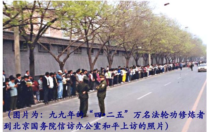
(图片为：九九年的“四·二五”万名法轮功修炼者到北京国务院信访办公室和平上访的照片)

共对民众的精神控制就开始失灵了，这是中共最怕的。因此，无论“4.25”上访是否发生，中共都会采取灭绝性手段迫害这上亿的“真善忍”修炼人群，这是中共的邪恶本性决定的。