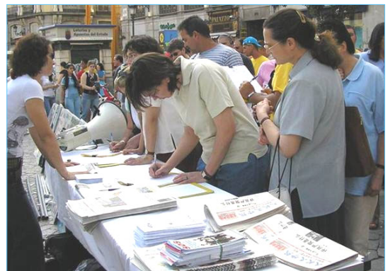
上图：民众踊跃签名支持西班牙法院调查中共犯下的群体灭绝罪。

相反，法轮功修炼团体始终如一的和平与理性的与邪恶势力抗争，也让越来越多的人感受到了“真善忍”的力量。法轮功学员经历的重重苦难正在不断的升华为一种精神价值，让人类从中获得教益。◇