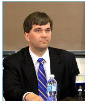
▲反器官摘取组织的发言人特莱医生在论坛上

【明慧网】加拿大蒙特利尔新闻报（The Montreal Gazette）五月十八日报导，一个国际医生组织警告说，国外的病人前往中国进行器官移植时，很可能会移植到从被关押的活人身上摘取的眼角膜、肾脏和肝脏，这些被摘取器官的人会因此死亡。