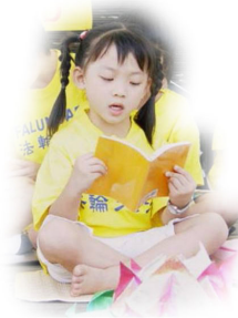
▲大法小弟子学大法书籍，在日常生活中修炼“真、善、忍”