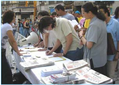
民众踊跃签名支持西班牙法院调查中共犯下的群体灭绝罪。

【明慧网】二零零七年四月十七日，正在出访西班牙的中共政治局常委吴官正被法轮功学员以酷刑折磨和群体灭绝法轮功学员的罪名起诉。自一九九七年起至二零零二年十一月，吴官正任职山东省中共省委书记期间，直接参与并执行了江泽民镇压法轮功学员的指令，在山东省酷刑折磨致死至少上百名法轮功学员。