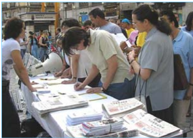
民众踊跃签名支持西班牙法院调查中共犯下的群体灭绝罪。

【明慧网】二零零七年四月十七日，正在出访西班牙的中共政治局常委吴官正被法轮功学员以酷刑折磨和群体灭绝法轮功学员的罪名起诉。自一九九七年起至二零零二年十一月，吴官正任职山东省中共省委书记期间，直接参与并执行了江泽民镇压法轮功学员的指令，在山东省酷刑折磨致死至少上百名法轮功学员。