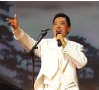
关贵敏在 2007 年全球华人新年晚会上演出

1983 年，39 岁的关贵敏歌唱事业正达高峰，却意外发现罹患乙型肝炎兼早期肝硬化。为了治病，他休养一年，四处求医，找偏方，并尝试各种气功，但都未见好转。关贵敏回忆道：“当时身体状态很差，比如领儿子太太到动物园，他们四处走，我走一会