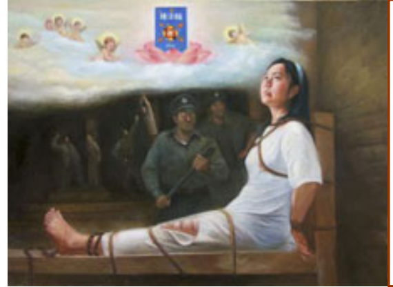
大法弟子美术作品 《无畏》

我从心底里敬佩法轮功学员们，即使抛开修炼这一层面，真、善、忍，仍然是人类社会道德修养的至高无上境界，如果世界上相当多的人秉承真、善、忍，人类社会将是何等的和谐、健全、幸福。愿法轮功在人类社会更加发扬光大，愿真、善、忍成为人们自觉的行动准则。