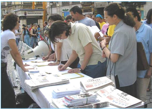
图：民众踊跃签名支持西班牙法院调查中共犯下的群体灭绝罪。

【明慧网】二零零七年四月十日，正在出访西班牙的中共政治局常委吴官正，被法轮功学员以酷刑折磨和群体灭绝法轮功学员的罪名起诉。自一九九七年起至二零零二年十一月，吴官正任职山东省中共省委书记期间，直接参与并执行了江泽民镇压法轮功学员的指令，在山东省酷刑折磨致死至少上百名法轮功学员。