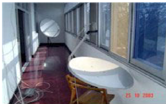
▲室内天线图示(窗户需朝南或朝西)透过窗户直接接收

分析人士认为，收看卫星广播电视呈上升趋势，这说明中国公民对外来的信息有很大的需求量，当局的打压反而助长了地下市场的兴旺。在这个科技发达、世界正逐渐变成“地球村”的时代，想要完全屏蔽公民接受境外信息是不可能的。