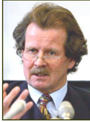
联合国酷刑问题 专员诺瓦克先生

◇ 以下移植中心的工作人员承认他们用活体法轮功器官做移植：上海中山医院器官移植门诊部，山东千佛山肝脏移植医院，广西南宁市民族医院，