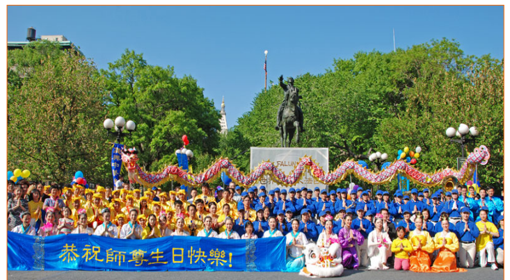
上图：纽约法轮功学员在曼哈顿联合广场庆祝大法日