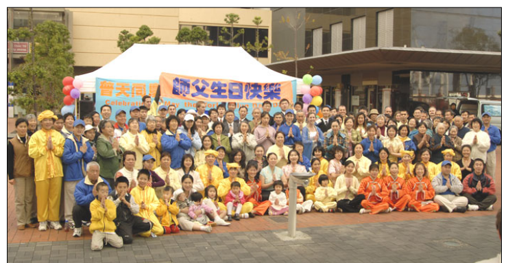
上图：新西兰大法弟子恭祝师尊生日快乐