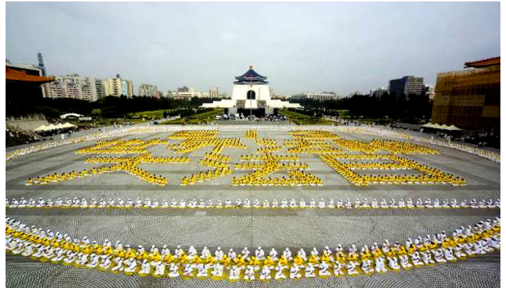
上图：五千名法轮功学员在台湾中正纪念堂排出壮观字形：“5.13 世界法轮大法日”，恭祝师尊生日快乐。