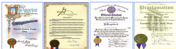
第八届世界法轮大法日期间，美、加各级政府发来贺状六十余份，褒奖法轮大法。

● 到目前为止，法轮大法已洪传世界 80 多个国家和地区，法轮功主要著作《转法轮》被翻译成 30 多种文字，现在越来越多各国民众了解了法轮大法的美好。世界法轮大法日，也越来越被人们关注。美国、加拿大许多各级政府还在这一天发出了对法轮功的褒奖令，并宣布该州、市的法轮大法日或法轮大法周、月。