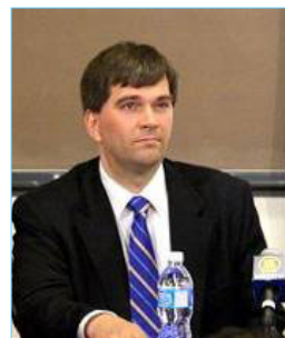
▲反器官摘取组织的发言人特来医生在论谈上

文章说, 在多伦多大学昨天举办的公众研讨会上, “反对摘取器官医生组织”说: 自二零零零年起, 中共一改过去从死刑犯身上获得器官的做法, 转而从活着的被关押的法轮功学员身上摘取器官, 以供应给不断发展的器官移植业。