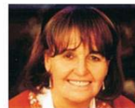
Baroness Caroline Cox