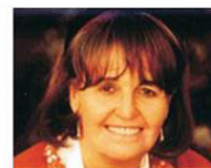
Baroness Caroline Cox