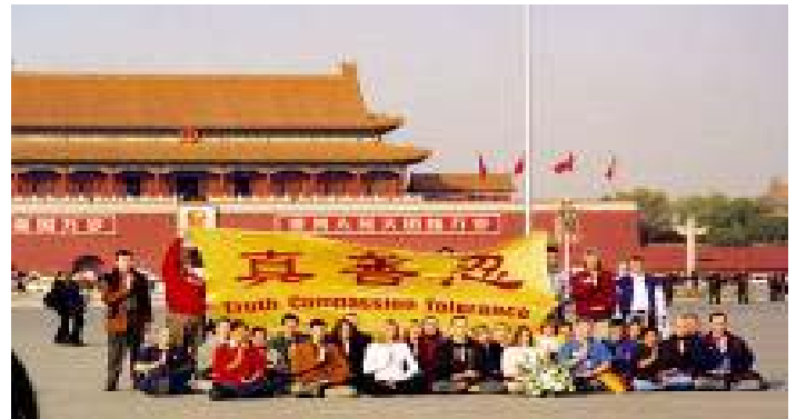
36 名西人法轮功学员在天安门打出横幅

杰瑞德说：“我们根本不需要多想。对法轮功的迫害是我所见过的最邪恶的，中共只因为这些人要做好人就迫害他们。我们一直在考虑怎么样制止这场迫害。”