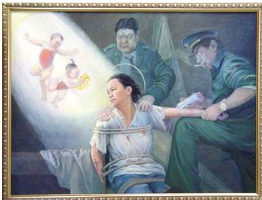
画展作品：光明与黑暗

真善忍国际美展的作品是由来自不同背景、卓有成就的艺术家所创作。九天的画展期间，参观者络绎不绝。每幅画作都在向参观者讲述