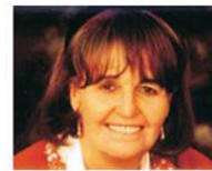
Baroness Caroline Cox