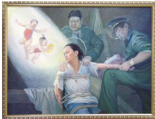
画展作品：光明与黑暗

许多都灵市民在参观完画展后都在问，为什么中共如此对待这些好人？中共一定是太惧怕这些有着无畏勇气的人们了，所以才失去了理智。◇