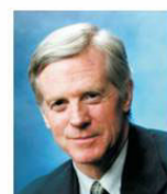
Hon. David Kilgour

【明慧网】关注法轮功人权状况的国际性组织“法轮功受迫害真相联合调查团（CIPFG）”与独立调查员、加拿大前国会议员大卫·乔高，日前致函中国国家主席胡锦涛和国务院总理温家宝，希望他们能在未来两月内结束对法轮功群体和高智晟律师等良心人士的迫害，指出奥运会和属“反人类罪”的迫害在中国同时进行将是全人类的耻辱。