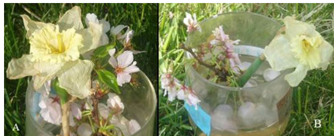
▲ 十天后的结果：A花绿叶依旧；B花已经惨淡

女儿从同一棵樱花树上摘下两枝花，略带点叶子，同时再摘了两朵大花，状况几乎一样。然后放在两个一样的瓶子里，装的一样多的水，放在一样的地方。然后贴上不同的英文标签，A瓶写着：“美丽、善良，真诚”，B瓶写着：“丑陋、撒谎、邪恶、暴力”。十天后，我惊奇的发现两枝花截然不同了，A花依然挺挺的，花姿茂盛，绿叶还长大了，而B花已耷拉了，小绿叶早就没了，没有一点精神。再过了一个星期，B花完全死了，