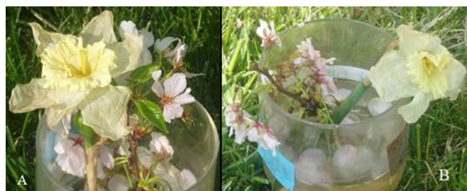
▲ 十天后的结果：A花绿叶依旧；B花已经惨淡

女儿从同一棵樱花树上摘下两枝花，略带点叶子，同时再摘了两朵大花，状况几乎一样。然后放在两个一样的瓶子里，装的一样多的水，放在一样的地方。然后贴上不同的英文标签，A瓶写着：“美丽、善良，真诚”，B瓶写着：“丑陋、撒谎、邪恶、暴力”。十天后，我惊奇的发现两枝花截然不同了，A花依然挺挺的，花姿茂盛，绿叶还长大了，而B花已耷拉了，小绿叶早就没了，没有一点精神。再过了一个星期，B花完全死了，