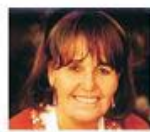
Baroness Caroline Cox