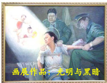
画展作品：光明与黑暗

许多都灵市民在参观完画展后都在问，为什么中共如此对待这些好人？中共一定是太惧怕这些有着无畏勇气的人们了，所以才失去了理智。