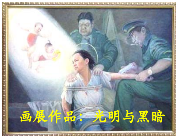
画展作品：光明与黑暗

许多都灵市民在参观完画展后都在问，为什么中共如此对待这些好人？中共一定是太惧怕这些有着无畏勇气的人们了，所以才失去了理智。