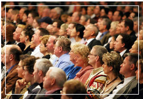
神韵艺术团震动严谨、保守的德国观众

然而法轮功所做的，不仅是在被中共迫害的过程中积极广泛的揭露中共的迫害，而且在受中共迫害的过程中，付出了