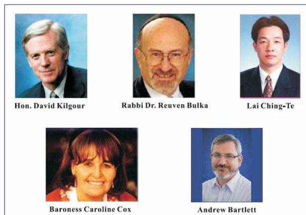
▲加拿大前国会议员大卫·乔高（上左）和“法轮功受迫害真相联合调查团”欧、亚、澳、北美四大分团团长

“法轮功受迫害真相联合调查团（CIPFG）”与独立调查员、加拿大前国会议员大卫·乔高，日前致函中国国家主席胡锦涛和国务院总理温家宝，希望他们能在未来两月内结束对法轮功群体和高智晟律师等良心人士的迫害，指出奥运会和属“反人类罪”的迫害在中国同时进行将是全人类的耻辱。