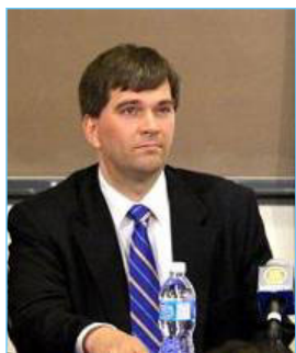
▲反器官摘取组织的发言人特来医生在论谈上