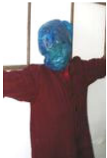
用塑料袋套头 (演示图)

恶警对他进行了毒打和残酷折磨，每二十四小时换一个地方，在每个地方都遭到的同样的毒打。特别是在县刑警队的那二十四小时里，恶警在他头上套上黑塑料袋，然后毒打，把他打的口鼻流血，