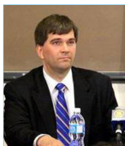
反器官摘取组织的发言人特莱医生在论坛上

【明慧网】加拿大蒙特利尔新新闻报（The Montreal Gazette）五月十八日报导，一个国际医生组织警告说，国外的病人前往中国进行器官移植时，很可能会移植到从被关押的活人身上摘取的眼角膜、肾脏和肝脏，这些被